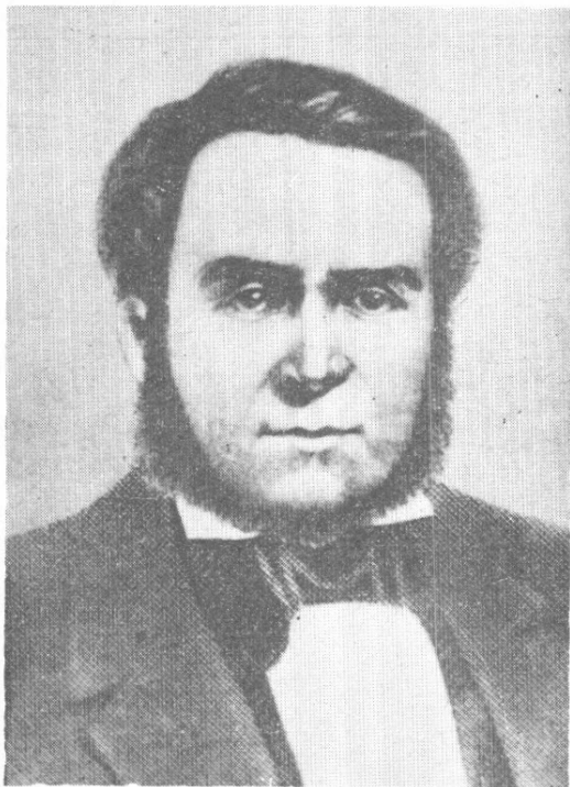
Don Juan Rafael Mora Fernández