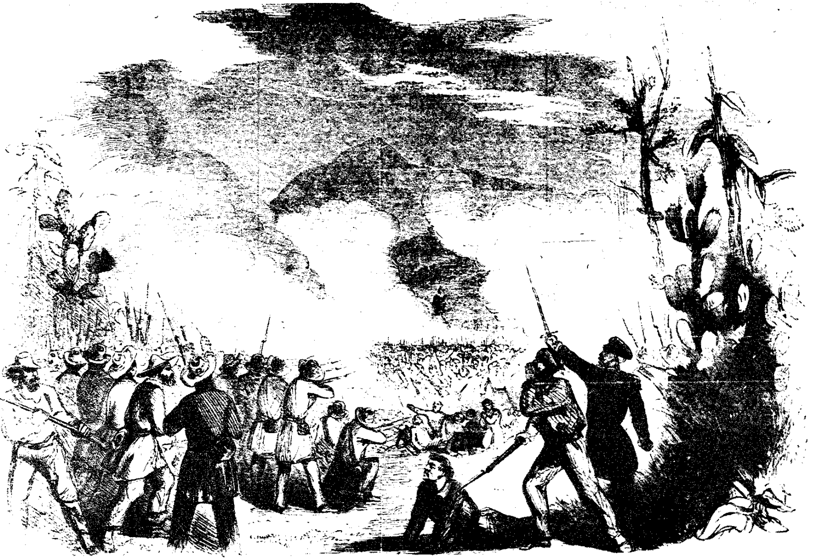
Brilliant battle of Quarisma (Lent), fought by Gen. Walker and Gen. Henningsen between St. George and Rivas, Nicaragua.