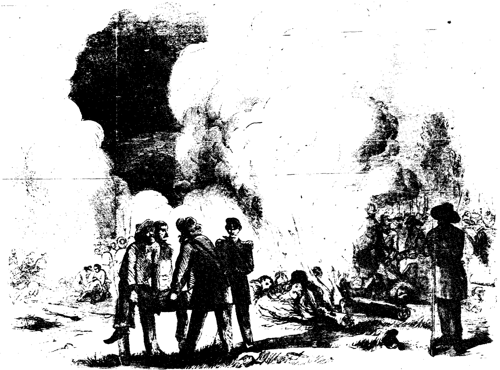
Walker's soldiers burning the dead bodies of the Costa Ricans after the battle of Quarisma.